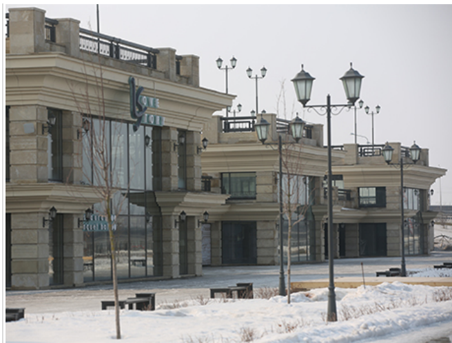
Проект набережной является для ПСО «Казань» инвестиционным. Компания уже вложила около 1 млрд. рублей

Проект набережной является для ПСО инвестиционным. Компания уже вложила около 1 млрд. рублей. «Миллиард ушел, но цифра поменяется — будет больше, — продолжает глава компании. — Все зависит от окончательного проекта». При этом уточняет, что несмотря на вложения, проект набережной не будет окупаться: «Вкладываю как горожанин». И добавляет: «Если кто готов присоединиться — пожалуйста». Сейчас нужен инвестор, готовый вложиться в благоустройство участка от Кировской дамбы до Ленинской.