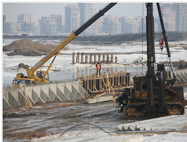
ПСО «Казань» построит три яруса подпорных стенок вдоль берега реки Казанки. Торчащие из воды сваи резервного моста будут убраны