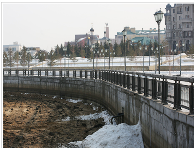
От ул. Батурина до НКЦ «Казань» благоустроен участок в 1278 метров. Сейчас компания приводит в порядок оставшийся участок — до моста «Миллениум», а это еще 1,4 тыс. м